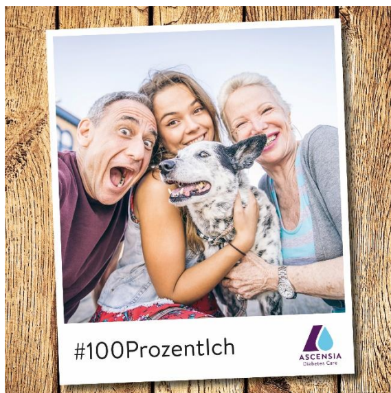
Der Abdruck ist honorarfrei, ein Belegexemplar wird erbeten.

Unter dem Motto „Das Gesicht deines Diabetes“ hatte Ascensia Diabetes Care Deutschland bereits zur zweiten Runde des Foto- und Videowettbewerbs #100Prozentlich aufgerufen. 100 Tage lang konnten Menschen mit Diabetes daran teilnehmen - nun hat ein Expertenboard den Gewinner gekürt.